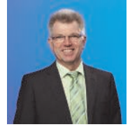
Bürgermeister Hans Jürgen Wessels

Die Gemeinde Altenbeken ist mit 9.300 Einwohnern die kleinste von zehn Kommunen im Kreis Paderborn. Zur Gemeinde gehören die drei Ortsteile Altenbeken, Buke und Schwaney. Wir leben hier im bevölkerungsreichsten Bundesland Nordrhein-Westfalen (NRW). Es gibt eine gemeinsame Verwaltung im Altenbekener Rathaus mit Bürgermeister.